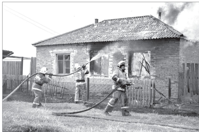
Квашино, 5 мая 2021 год